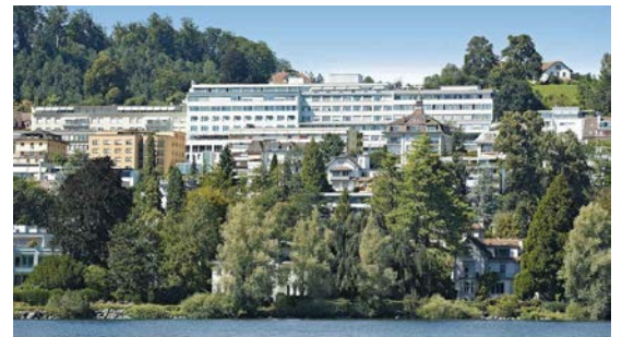
Die Klinik St. Anna wird „universitär“.